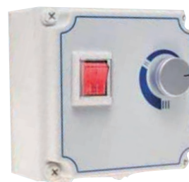
RVM5 - RMV9 - RMV20