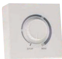
RVM1V5 - RMV3